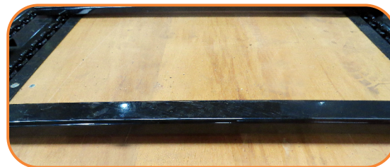
Producido con piso en madera naval.