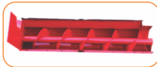
Su sinfín transportador es indicado para descargar varios forrajes como el maíz, el sorgo, la caña-de-azúcar y una amplia gama de hierbas cortadas y picadas con hasta 7 mm.