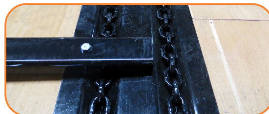
Cadena de acero especial, durable y de fácil mantenimiento.