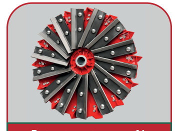
Potente rotor con 14 cuchillas