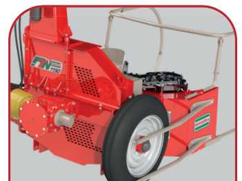
Estructura reforzada con rueda de apoyo