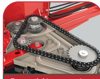
Transmisión por cadena