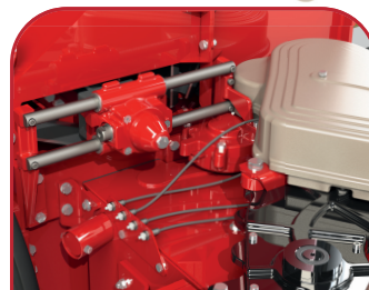
Sistema sencillo de afilado y lubricación centralizada