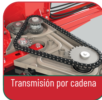
Transmisión por cadena