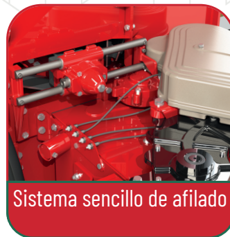
Sistema sencillo de afilado