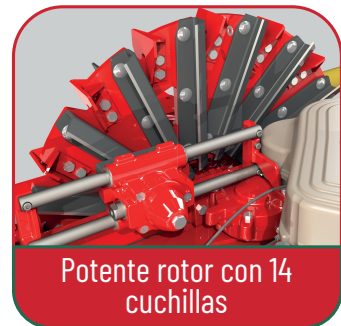
Potente rotor con 14 cuchillas