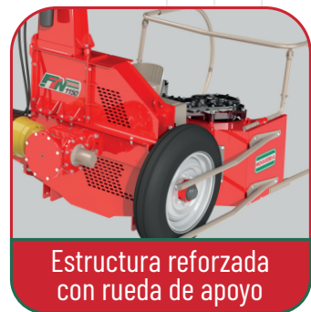
Estructura reforzada con rueda de apoyo