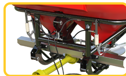
Fácil acesso e regulação dos dosadores