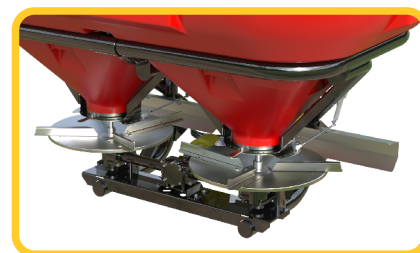
Discos que permitem lançar de 16 a 36m com distribuição uniforme