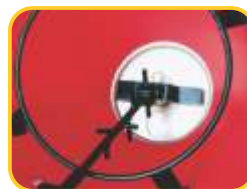
Kit especial: agitador e trilho