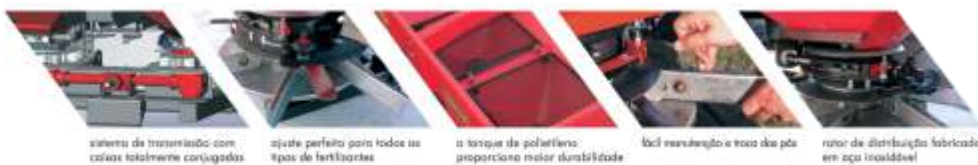
sistema de transmissão com caixas totalmente conjugadas