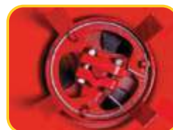
Agitador com sistema oscilante