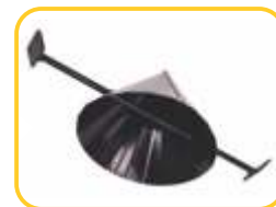
Cone Chapéu Chinês para sementes