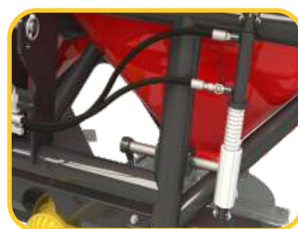
Fácil acesso e regulagem dos dosadores