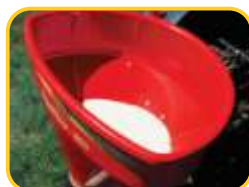
Em ação no campo