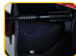
Regulagem de saída simplificada