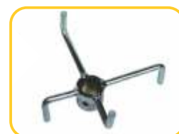
Agitador para adubos e sementes