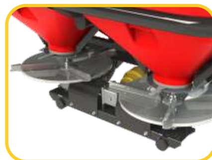
Discos que permitem lançar de 16 a 36m com distribuição uniforme