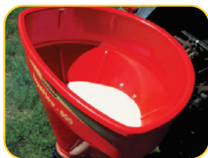
Em ação no campo