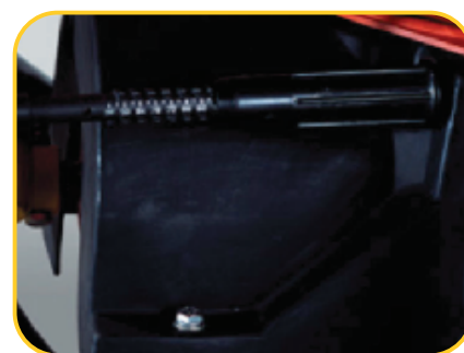
Regulagem de saída simplificada